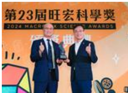
教育部次長林騰蛟多次出席活動給予指導與鼓勵