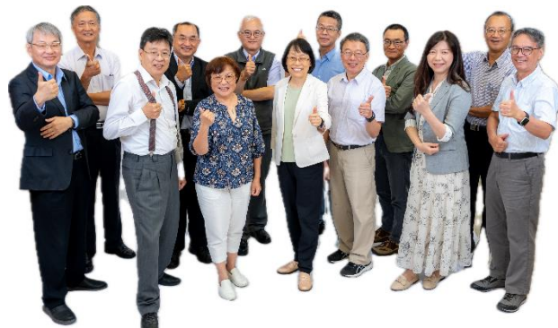
旺宏科學獎評審團陣容堅強