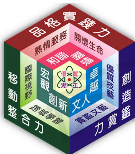
表 1 學校願景及學生圖像說明