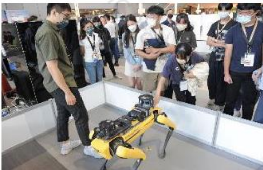
參加台積設備博覽會