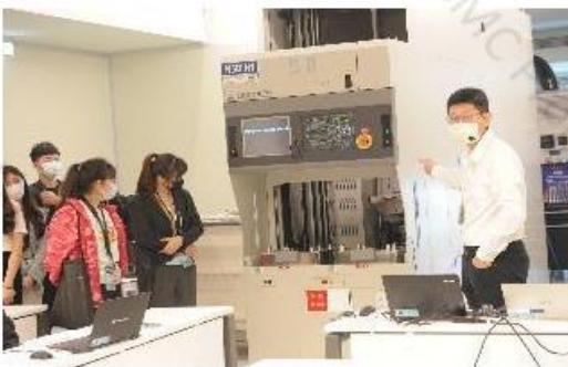
導覽台積新人訓練中心(NTC)