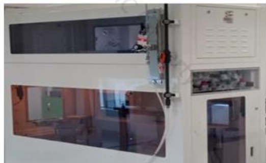
參加台積新人訓練中心課程